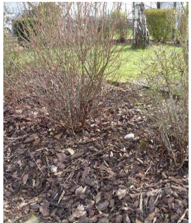
Paillage d'écorces dans un massif

Astuce : Vous pouvez ainsi jouer avec les matières et les couleurs pour décorer vos massifs.