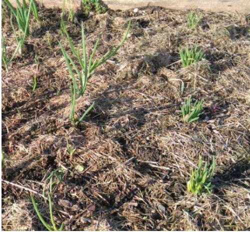
Paillage de tonte de pelouse dans un potager

La tonte de pelouse est un paillis à renouveler plus régulièrement que les autres. Il faut la laisser sécher avant de la déposer. Ensuite, elle s'agglomère, ainsi elle ne s'envole pas au premier coup de vent. Dans le potager, mettez-en 2 cm. Ailleurs, vous pouvez mettre jusqu'à 20 cm d'épaisseur.