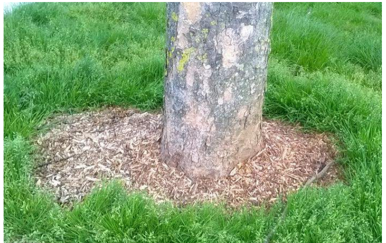
Paillage de broyat de branchage au pied d'arbre

Soyez généreux : mettez en 10 cm d'épaisseur au minimum.