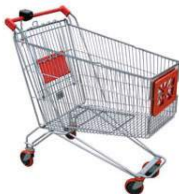
CHARIOT DE RÉFÉRENCE 83KG DE DÉCHETS D'EMBALLAGES PAR PERSONNE ET PAR AN