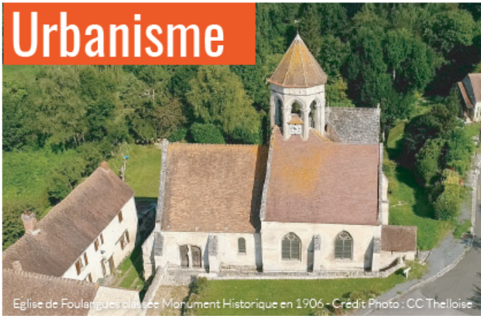
Eglise de Foulanguies classée Monument Historique en 1906